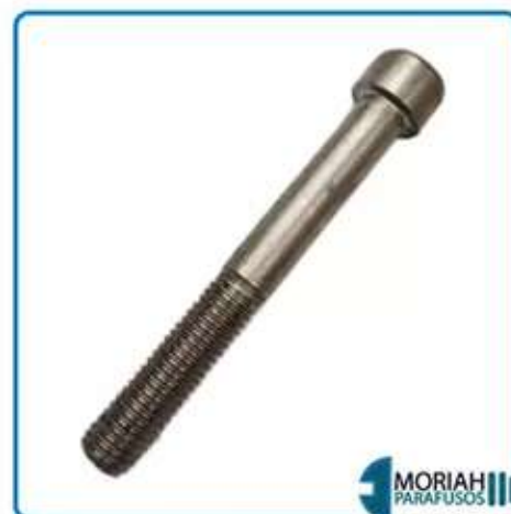
ALLEN ROSCA PARCIAL